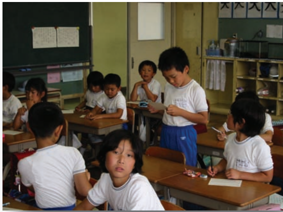
終了後の教室で感想文を読んできた児童

したが、雨がやんでくれたので、山へ行くことができました。ただし、当初予定した頂上付近へ登ることができなかったため、途中の神社